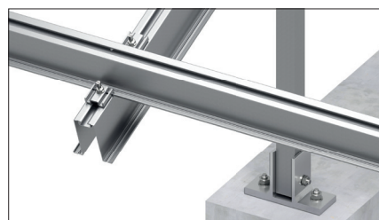
A modul alátámasztás csatlakoztatási részlete