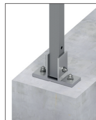
Desky na nohy s fixačními kotvami