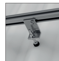
Bølget tagsten af metal