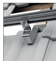
Dobbelte tagsten i panelsystem