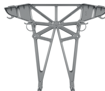
Središnji oslonac 15° za užnu orijentaciju