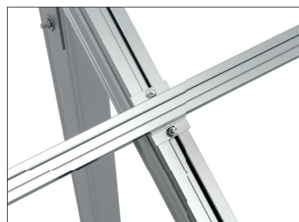
Dettaglio della connessione Supporto - rafter