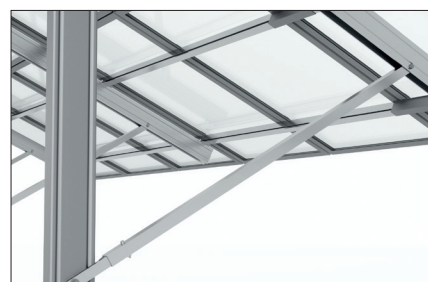
Dettaglio della connessione diagonale al palo C