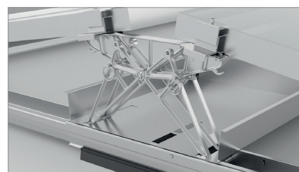
Support central 10°