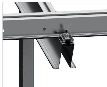
Dettaglio della connessione support del modulo