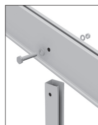
Detail spojení nohy a krokve