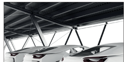
Bis zu 6 Fahrzeuge pro Segment