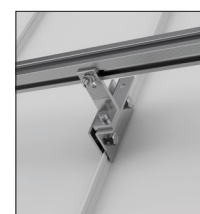
Cucitura in piedi