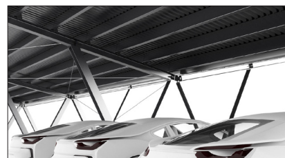
De la place pour jusqu'à 6 voitures