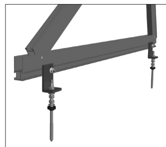
Adaptador para tornillos de sujeción