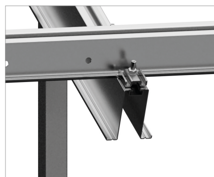
Dettaglio della connessione support del modulo