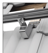
Dvojité panelové škridly