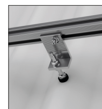
Dakhaak met railkoppeling