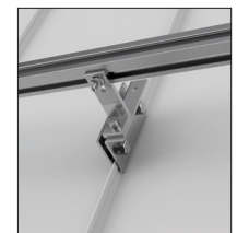
Costura de pie