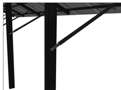
Fixarea diagonalei la pilon cu profilul C