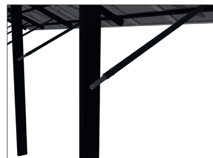
Bevestiging van diagonalen aan de C-palen