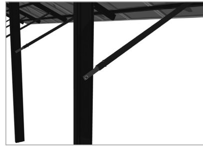
Bevestiging van diagonalen aan de C-palen