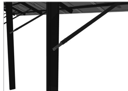
Reposapiés delantero con anclaje fijo