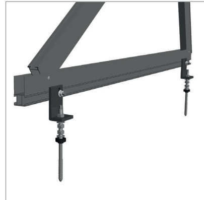
Adapter für Stockschrauben