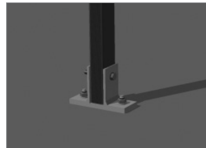
vordere Fußplatte mit Fixanker